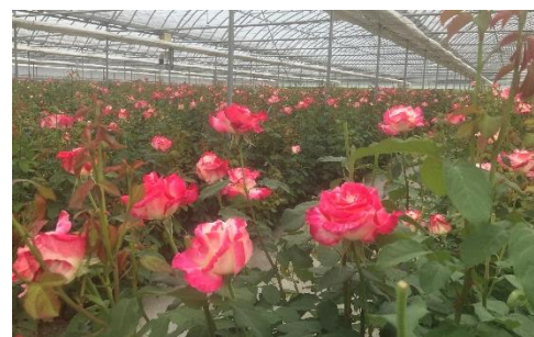
ナリス ローズガーデンのダブルデライト 5月撮影

今回の「ダブルデライト」の花弁発酵物の開発により、バラ花弁の抽出物の効果を維持したバラ花弁抽出物の乳酸菌発酵物の高配合が可能となり、従来の効果よりも高い効果を発揮できると考えます。また、肌への安全性が高まったことで敏感肌の人や乳幼児でもバラ花弁の抽出物の効果を維持したバラ花弁抽出物の乳酸菌発酵物を配合した製剤の使用を可能にすると考えます。