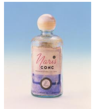
1937 年 ナリス化粧品 初のふきとり化粧水「コンク」

創業 5 年後の 1937 年に、研究職だった創業者の村岡満義が当社で初めて「ふきとり化粧水」を発売しました。余分な老化角質を取り除くことにより、肌のターンオーバーに働きかけ、後で使用する化粧品の浸透を高めることが目的であり、ふきとることが目的でなく、後で使用する化粧品の栄養を与えることが美肌にとって重要なことだと考えたようです。当時は「塗り重ねること」がスキンケアの常識であったため、常識を覆した商品として注目を浴びました。スキンケアで使用する「化粧水」は、洗顔の後に 1 品を使用することが一般的ですが、当社では洗顔の後に「ふきとり化粧水」を使用してから「化粧水」を使用するという 2 種類の化粧水を使用する独自の美容理論のもと商品を構成しています。当社は 1932 年の創業当時から社内に研究開発部門があり、角層研究は約 90 年に及びます。当社の調査では、ふきとり化粧水の認知率は 7 割を超え、美容に関心のある女性の 9 割超がふきとり化粧水を使用しており、美容意識の高い人に使用されているアイテムとして認知が広がっているようです。なお、当社は 2017 年にふきとり化粧水の国内販売シェア第 1 位を記念し、日本記念日協会に 2 月 10 日を「ふきとりの日」と申請し、認定されています。