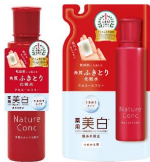
ネイチャーコンク

各社の状況を見ると、10 位までの企業は横ばいから縮小傾向にある中、10 位以下の企業の新規参入や低価格化、また 1 品でスキンケアできるふきとり化粧水が増加しています。当社のこれまでの調査では、ふきとり化粧水の使用者は美容意識が高い人が多く、その理由として通常は 1 品で済む化粧水のステップが「ふきとり化粧水」と「化粧水」の 2 ステップになることから、それでも美容のために使いたいと思う人がメインのユーザーであると捉えてきました。