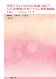
厚生労働省等 「保険外サービス活用ガイドブック」