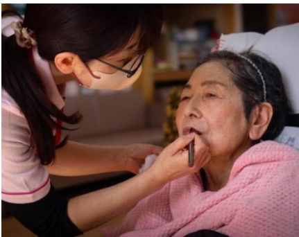
セラピストの活動事例（若手県胆沢郡）

当協会では、全国でセラピストを養成できるインストラクターの輩出にも注力しています。インストラクターは、協会がその卓越した知識と技能を認めたスペシャリストのための資格です。ハンドセラピー・フェイシャルセラピー・メーキャップセラピー・介護基礎が総合的に学べる認定基本講座を受け、ビューティタッチセラピストの認定後、養成期間を併せて3年の実務経験を積み、加えて専門講座であるフットケアセラピーの能力を有したセラピストの中から選出されます。フットケアセラピーは、第2の心臓とも呼ばれるふくらはぎを刺激し、むくみや足裏のアーチ崩れを防ぐことで、転倒を防止するマッサージトリートメントで、特に力を入れています。インストラクターは2025年度に新たに3名の認定者を輩出し、2026年3月末時点で合計29名に上ります。