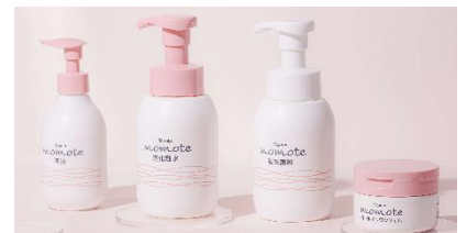
高齢者向け化粧品「モモテ」