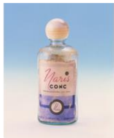
初のふきとり化粧水 コンク