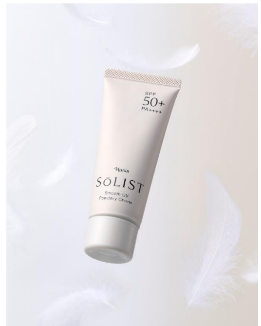
商品名：ソリスト スムースUV パウダリークリーム 容量：60g 価格：1,600円（税抜）1,760円（税込） お客様からのお問い合わせ先：ナリス化粧品 お客様相談室 TEL:0120-71-9000

「ソリスト」ブランドは、日焼け止めの基本機能である「日焼けしない」にプラスアルファの価値を提供することをコンセプトにスキンケア効果を提供してきました。今回の新製品「スムースUV パウダリークリーム」は、スキンケア効果はもちろんのこと、新たなプラスアルファの機能として「とにかくサラサラで心地よく塗り直しができる」ことを提供。猛暑で高湿度の日本の長い夏を快適に乗りきるための日焼け止めです。