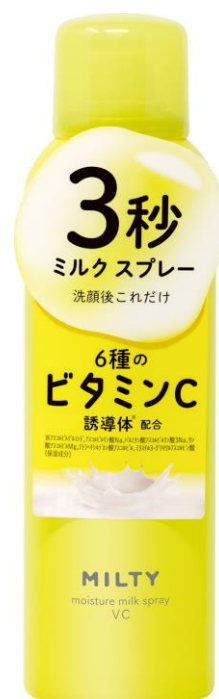
ミルティー モイスチャーミルクスプレー VC 価格：オープン価格 参考価格：1,100 円 （税抜）1,210 円（税込）容量：140 g （約 90 回分） お客様相談窓口：0120-32-4600