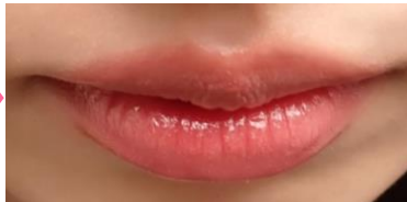
リップミューターを塗布しティント口紅を塗った状態

「ヌードリップミューター」は、主張の強い唇の色を黙らせるための唇専用下地。「粘膜色ヌードベージュ」のカラー名の通り、チップで唇に塗布した後にトントンと指で唇になじませるだけで簡単に唇の色を絶妙なヌードカラーに整えます。さらっと伸びて唇にびたっと密着。その後使用する口紅と混ざりづらく、唇の縦ジワも埋めるので、口紅のノリを良くして発色を高めます。