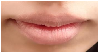
ヌードリップミューターのみ塗布した状態