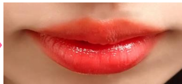
唇に直接ティント口紅を塗った状態