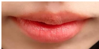
唇に何も塗っていない状態

商品名：ヌードリップミューター（粘膜色ヌードベージュ） 価格：1,200円（税抜）1,320円（税込） 発売日：4月25日 お客様からのお問い合わせ先 ナリス化粧品 お客様相談窓口 TEL:0120-32-4600