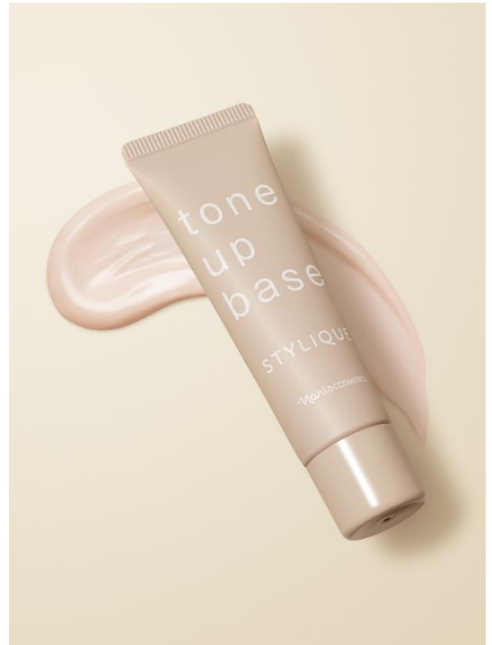
商品名：スタイリーク トーンアップベース 内容量：30g 価格：3,000円(税抜) 3,300円(税込) お客様からの問い合わせ先 お客様相談窓口 0120-71-9000

W-C-C-C-Fの美容理論に基づいて開発した「スタイリーク トーンアップベース」は、ベースメイクの仕上げだけでなく、つけることで肌を美しくしていくことを目指す、言わば「美容液化粧下地」。日中用の美容液を塗るようなイメージで使用できることを目指しています。天然ビタミンE/トコフェロール、セラミドNP、ハイブリッドローズ花エキスなどの保湿成分が、つけるたび肌に潤いをもたらします。