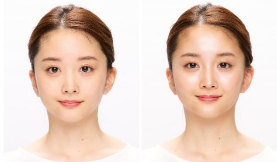
ファンデーションのみ