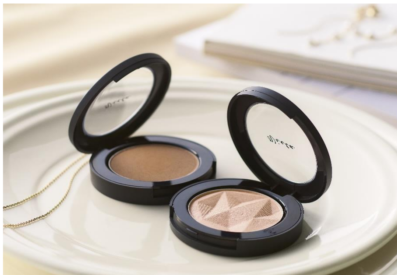
右手前 製品名：Vieta ルミナスデザイン ハイライト 左上：製品名：Vieta フレームデザイン シェーディング 価格（2品ともに）1,500円（税抜）1,650円（税込） 発売日：6月21日 お客様からの問い合わせ先：0120-71-9000