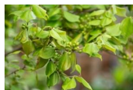
天台烏薬（テンダイウヤク）

今回のリニューアルで新しく配合したのは、和歌山県新宮市産の天台烏薬（テンダイウヤク）の葉から開発したテンダイウヤク葉エキス（保湿成分）と、三重県熊野市の新種の柑橘である完熟の新姫（ニヒメ）の果皮から開発した新姫エキス/シトルス（タチバナ/レチクラタ）果皮エキス（保湿成分）。国産の植物の未知なるチカラを発見し、化粧品に配合できる成分として開発に成功するまでに約7年を費やしています。また、従来から「セルグレース」に配合しているオリジナルの植物成分のシマホオズキ果実エキス（保湿成分）に加えることで、さらなる力を発揮することが期待できます。当社は、90年前の創業時から研究部門を持ち、多くのオリジナル成分を開発してきたことにより、オリジナリティの高い製品開発を実現してきました。6品それぞれのアイテムには、目的を果たすためのそれぞれの成分を配合。配合技術の高さが、効果を支えます。