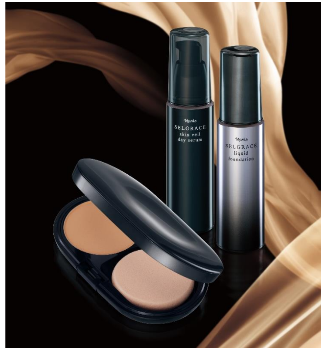
商品名：セルグレース パウダーファンデーション（手前） 価格：6,000円（税抜）6,600円（税込） ケース別売り 価格：2,000円（税抜）2,200円（税込） お客様からの問い合わせ先 お客様相談窓口 0120-71-9000