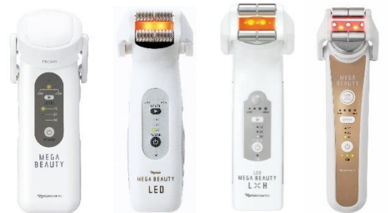
2001年～初代メガビューティ 2005年～メガビューティ LED 2009年～メガビューティ LxH 2018年～メガビューティ

2001年にデビューした家庭用美顔器の先駆け「メガビューティ」。今では、美容意識の高い女性への普及が進んだ家庭用美顔器ですが、当時は非常に珍しいものでした。開発の目的は、当社のメインアイテムである「ふきとり化粧水」※を活かすことでした。日々のスキンケアのステップをメガビューティを使って行うだけで、おうちがエステサロンになるメガビューティは、忙しい現代の女性に受け入れられ、3度のリニューアルでバージョンアップ。販売台数は80万台を突破しました。今回の「メガビューティ エステティック」はまさに逆転の発想。メガビューティを活かすための初めての化粧品です。メガビューティのもつ、「HOT 機能」や「COOL 機能」と化粧品が叶えるコラボレーションで、おうちエステの満足度をさらに向上させます。