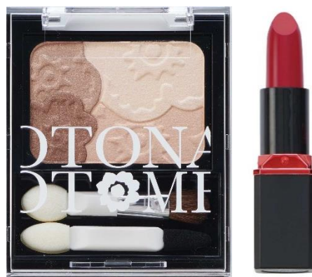
イエローベースの肌の方に