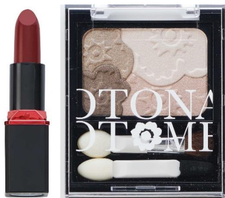
ブルーベースの肌の方に

赤系口紅や、ブラウン系アイシャドウは、ひと時の流行ではなく、もはや定番となり、その中で質感の違いで流行や自分らしさを表現する女性が増えています。特に若い頃と同じメイクをしていると、不安だと考えている女性に「きちんと感」を演出できるメイクとして選びやすい4アイテムを開発しました。クールな色味が似合うブルーベースと暖かい色が似合うイエローベース、それぞれの肌の特徴を生かす設計をしているため、失敗がなく自信のあるメイクを叶えます。また、セミマットな口紅や、ギラつきすぎないアイカラーは、大人女性に必要な「きちんと感」を演出できます。