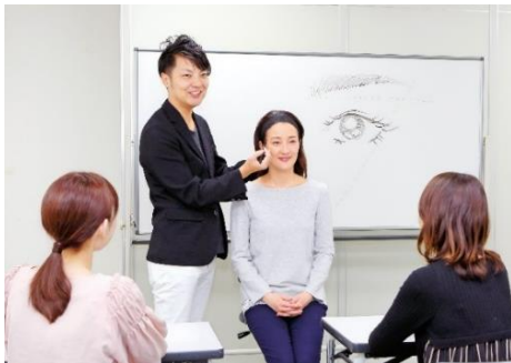
メーキャップ研修の様子