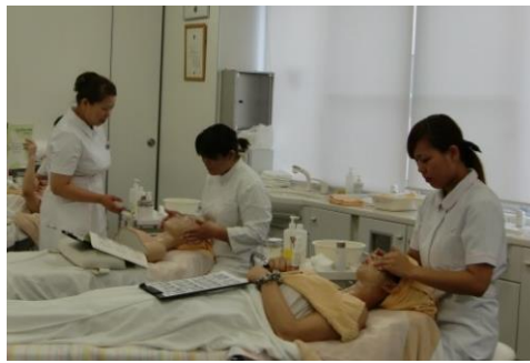
エステティック研修の様子