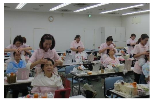
介護美容研修の様子