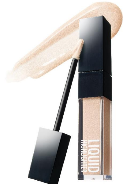
リキッドハイライター 発売日：2020年3月21日 お客様からのお問い合わせ先 ナリス化粧品 お客様相談室 TEL:0120-71-9000

当社の調査※によると、メイク品 12 アイテムの使用状況を年齢別に聞いたところ、下図のとおり、使用アイテム数は年齢と反比例することがわかりました。メイクの好みは、メイクを始めた時の流行や年齢に左右されるものですが、若年層と高齢層では、「ノーズシャドウ」や「ハイライト」が使用率に特に大きな開きがあることがわかりました。若年層は、ファンデーションの使用率が低く、その代わりにハイライトや、ノーズシャドウで立体感を演出している人が多いこと、高齢層は、ファンデーションだけで、肌づくりが完了している人が多いことが伺えます。(※ 実施日 2019年 11月1日～11月8日 全国 15才～54才女性 n=2,021。インターネット調査)